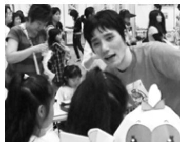
実は、着ぐるみきらりんボランティアもしていただきました。

今度の作品は、30分あれば作れます。(普通のコピー用紙にA4で印刷してください。) 新潟市社協ホームページや、ボラセンブログにてダウンロードできます。(URLは表紙右上に)