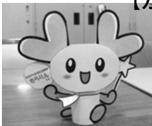
カッターを使う部分は、大人の方が手伝ってあげてくださいネ！

今度の作品は、30分あれば作れます。(普通のコピー用紙にA4で印刷してください。) 新潟市社協ホームページや、ボラセンブログにてダウンロードできます。(URLは表紙右上に)