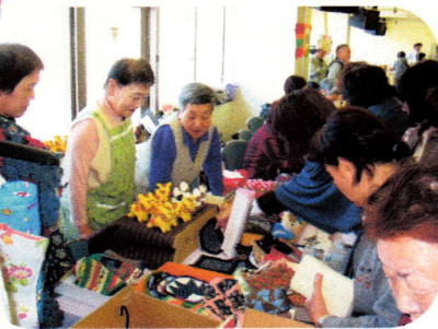
「これかわいいわね!」

雑貨コーナーも、手づくり品コーナーも大人気! ボランティアさんとのおしゃべりも楽しいひとときです!