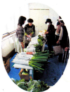
「採れたて新鮮野菜を楽しみに朝から待ってたよー!」