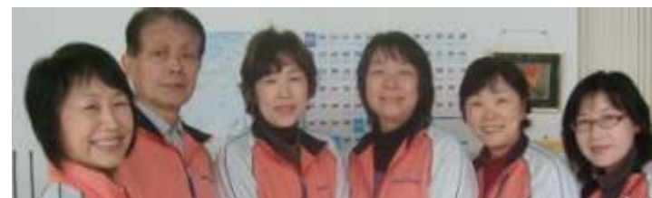
西区まごころヘルプ

皆さまとの絆を大切に今年もコーディネーター業務に取り組んでいきます! まごころヘルプスタッフ一同