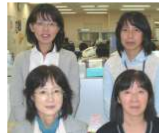
東区まごころヘルプ