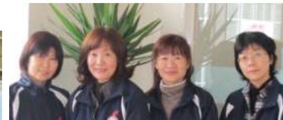
中央区まごころヘルプ