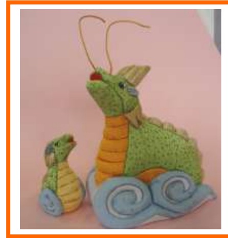
今年も干支の木目込み人形をご寄付いただきました

まごころヘルプ会員の皆様、新年明けましておめでとうございます。 皆様方には、お健やかに輝かしい新春をお迎えのこととお喜び申し上げます。 昨年は東日本大震災という未曾有の大災害が発生しました。改めて被災された多くの皆様に心よりお見舞い申し上げますと共に、一刻も早い復旧・復興をお祈り申し上げます。 さて、東区まごころヘルプは昨年9月、東区役所及び東区社協の移転と同時に、旧イトーヨーカ堂本戸店へ移転しました。 新事務所はおかげ様で広く明るくなり、会員の皆様にお集まり頂けるスペースもご用意しておりますので、お近くにお越しの際はどうぞお気軽にお立ち寄り下さい。 少子高齢化、核家族化が進み、近所付き合いが少なくなったと言われておりますが、そんな時代だからこそ、住み慣れた地域で暮らし続けたいと願う気持ちは益々強くなってきているのではないのでしょうか。 私たち東区社協は、これからも「誰もが住み慣れた地域で安心して暮らし続けることのできる支え合い・助け合いのまちづくり」を目指し、まごころヘルプ、ボランティアセンター、地域福祉部門、介護サービス部門等が連携し、力を合わせて地域福祉を推進していく所存です。 本年もご支援・ご協力をお願い申し上げますとともに、皆様のご健勝とご多幸を心からお祈り申し上げます。