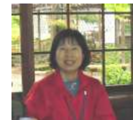
江南区まごころヘルプ