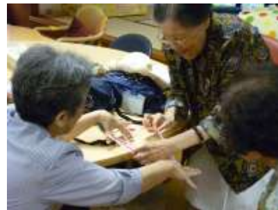
みんなで楽しむ「あやとり」♪