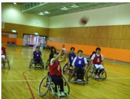
車いすバスケットは、とても楽しいスポーツです。 (平成20年度夏休みボランティア体験学習より)