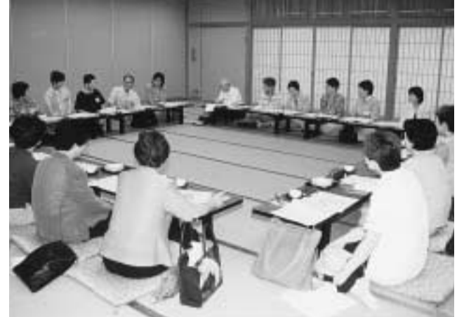
日ごろの様子を語り合う参加者の皆さん