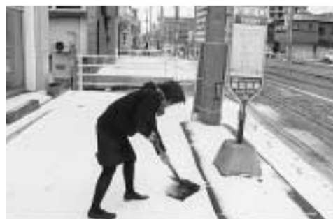
今年もみなさんのご協力を!