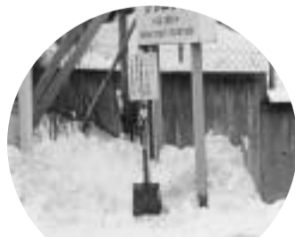
市内197ヶ所に設置されます。

この冬も197ヶ所に雪かき用のスコップを設置し、バス等の待ち時間を利用したひとかきの協力を呼びかけています。街中でこの看板を見かけたら、運動の趣旨をご理解いただき、ひとかきのご協力をお願いします。