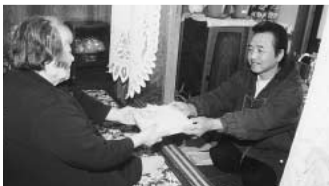
お節料理に笑顔いっぱい

年々訪問世帯も増え、ボランティアの訪問を心待ちにしておられる方も多く、住みなれたまちで安心して暮らせる「地域づくり」に役立っています。