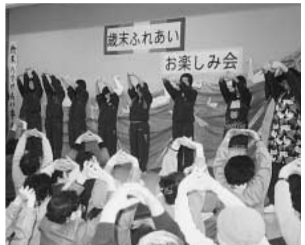
みんな一緒に楽しい一日