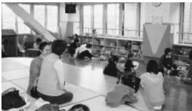
子どもたちの笑い声と、和やかな雰囲気がプレイルームに流れます。

平成14年度は、50を超えるグループの方々が、プレイルームを利用しました。プレイルームでは、「新潟おもちゃの会」による、おもちゃライブラリー(第1・3・4木曜)も開かれており、フリーで参加できます。