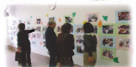
一定例会やお茶の間の様子を 写真で紹介一