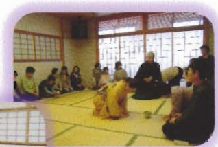
わかりやすい茶道の お話を聞きながら お抹茶を楽しみました!