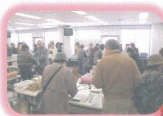
おかげ様で 大盛況!