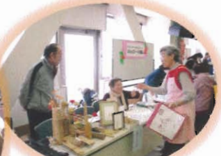
あれこれ話しながらの 買い物って楽しい!