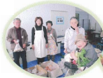
朝どり新鮮野菜と 干柿が大好評!