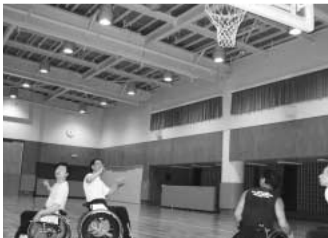
ホール内に、楽しく激しい練習の音が響きます。