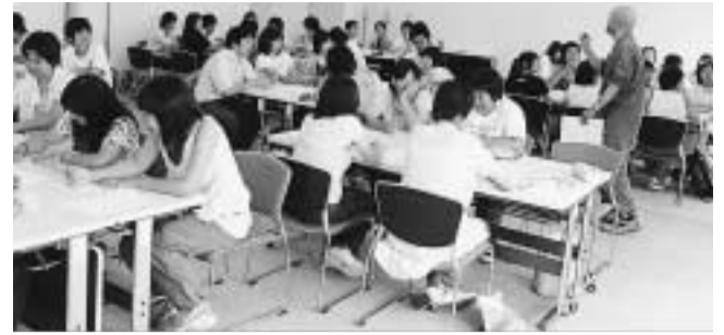
ボランティアについてみんなで考えよう。

今年は、中学生・高大生43人が一緒に参加するプログラムとし、ワークショップ形式によるオリエンテーションの時間を持ち、参加者の意見などを発表したり、確認したりするなどの試みをしました。その他にも、3日間の施設体験や障害のある方のお話、手話や点字講習などを通して、参加者は感動するものがあったり、自分を見つめ直すきっかけになったようです。