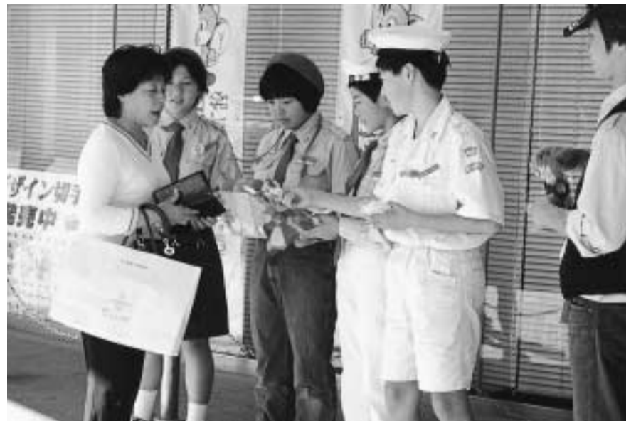
ご家庭で、職場で、学校で、共同募金はいつでも、どこでも参加できるボランティア活動です。

今年も10月1日から全国一斉に共同募金運動が実施されます。みなさんからは、街頭で、ご家庭で、職場で、学校等で、その立場、立場でご協力をいただいております。お寄せいただいた募金は、このように活用されます。