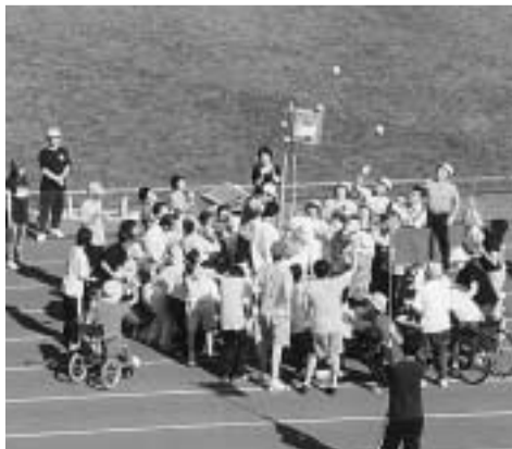
どのチームの玉数が一番かな！

また、市内の障害者福祉施設で製作された作品等を販売するバザーも大盛況でした。来年、またみんなで会いましょう。